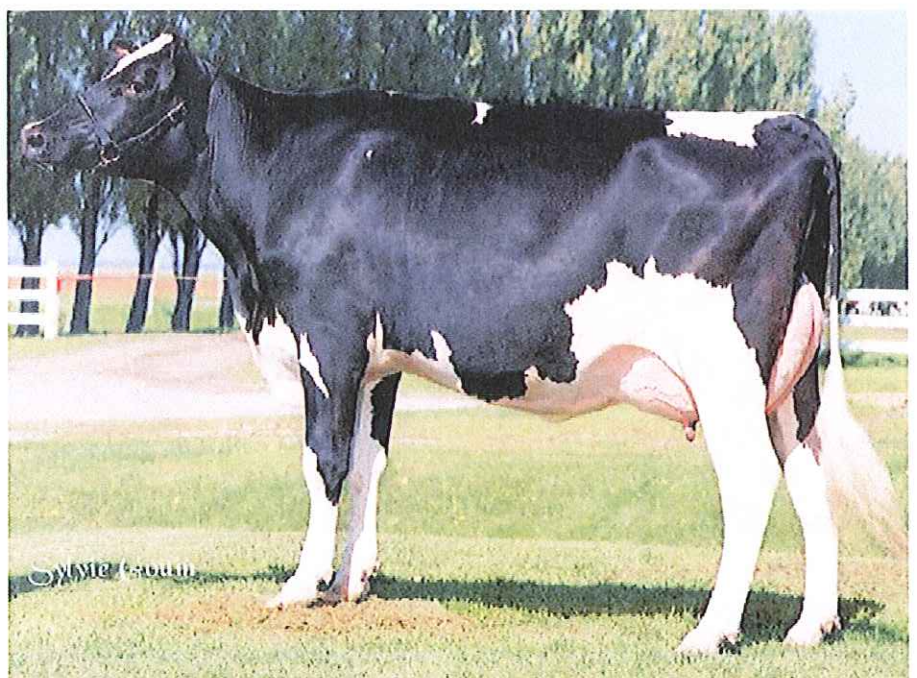
Canada's kampioensfokkoe, La Presentation Daurel EX, heeft nu 50 sterren.