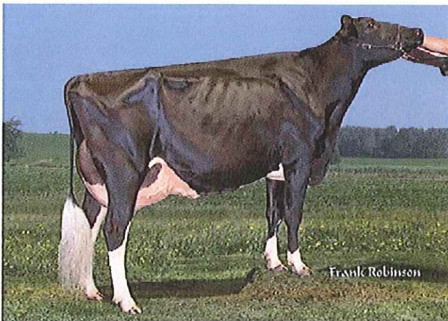
Daurel's Goldwyn-dochter, La Presentation Leona VG-89, was deze zomer Grand Champion op Expo St-Pascal.